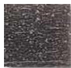
Gris Oscuro (O.4)