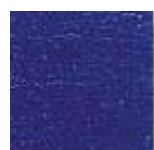
Azul Cobalto (O.42)