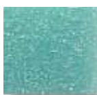
Verde Mar 1 (C.50)