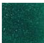
Verde Mar 3 (P.48)