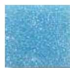
Celeste 2 (M.16)