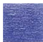
Azul Mediano (M.24)