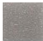
Gris Mediano (M.3)