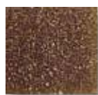
Ambar Oscuro (O.12)