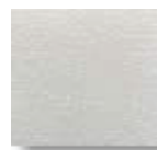
Gris Claro (C.2)