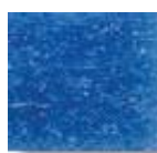
Azul Celeste 1 (M.43)