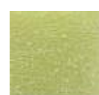
Verde Limón claro (C.14)