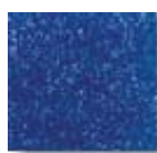
Azul Celeste 3 (O.44)