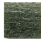
Gris Verdoso (N.21)