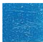
Celeste 3 (O.22)