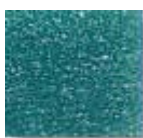
Verde Mar 2 (M.49)