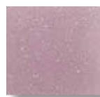
Lila Claro (C.28)