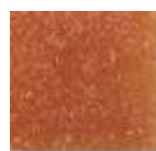
Ambar Mediano (M.8)