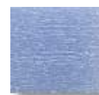
Azul Claro (C.32)