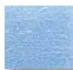
Azul Celeste 2 (C.41)