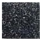
Negro Azulino (N.01)