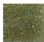
Verde grisáceo (N.19)