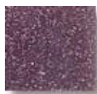
Lila Oscuro (O.30)