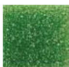
Verde Mediano (M.20)